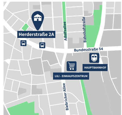
Zentrale Lage mitten in Wiesbaden

Beste Voraussetzungen, um in der Landeshauptstadt schnell und einfach Fuß zu fassen.