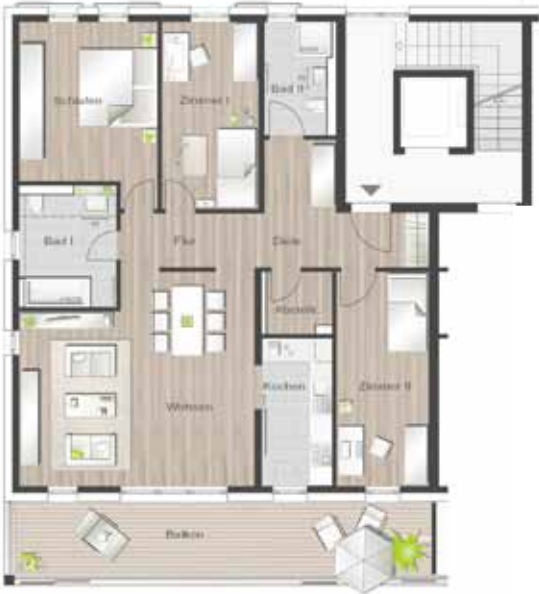
Wohnung Nr. 2.5/4.5/5.5 2. OG, 4-Zimmer-Wohnung