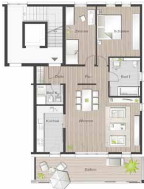
Wohnung Nr. 2.6/4.6/5.6 2. OG, 3-Zimmer-Wohnung